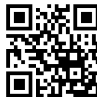
X (旧 Twitter)